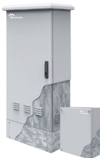
ARMOIRES ET COFFRETS ACIER GALVANISÉ PEINT