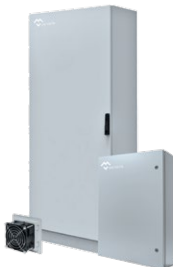
COFFRETS ARMOIRES ELECTRIQUES CEM