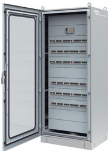
ARMOIRE MODULAIRE DE DISTRIBUTION