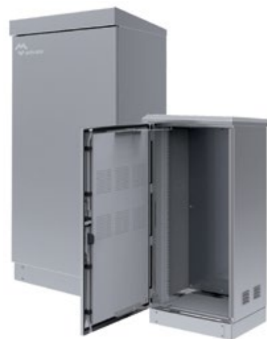
ARMOIRES RACK 19 RESEAUX TELECOMS OUTDOOR IP