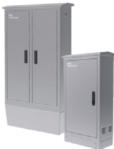
ARMOIRES ELECTRIQUES D'EXTÉRIEURS