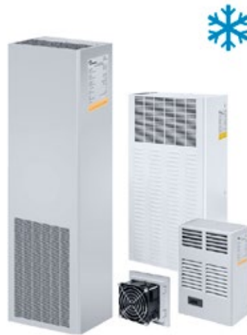
VENTILATION ET CLIMATISATION