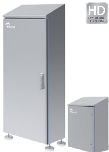
COFFRETS ARMOIRES HYGIENIC DESIGN