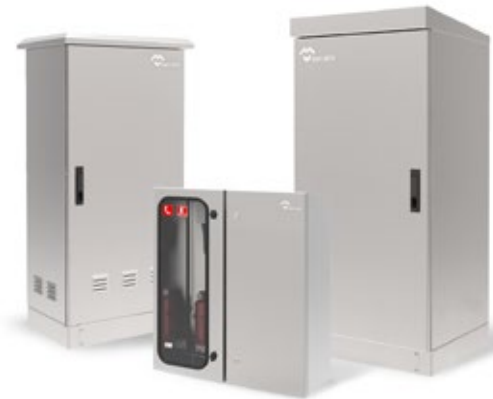
ARMARIOS DE INTEMPERIE ESTANCOS