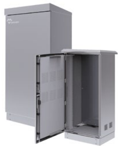
RACKS DE 19 EXTERIORES TELECOMUNICACIONES IP