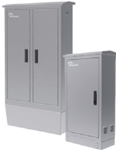
ARMARIOS ELÉCTRICOS DE INTEMPERIE ESTANCOS