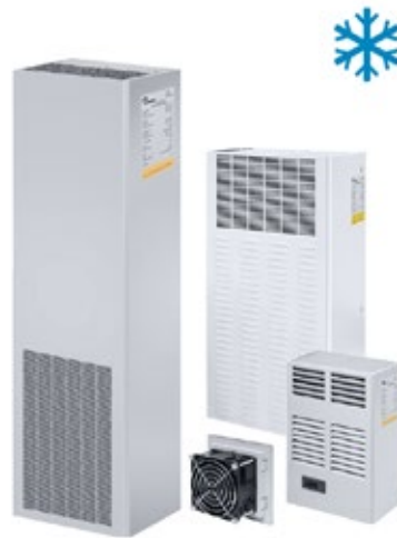
VENTILATION ET CLIMATISATION