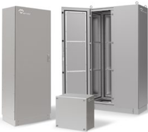
CAJAS Y ARMARIOS ELÉCTRICOS INOXIDABLES

Servicio ágil en un plazo máximo de 3 semanas desde la recepción del pedido. Totalmente flexibles, para todos los formatos y dimensiones. Somos el fabricante con mayor dimensiones certificadas en el mundo.