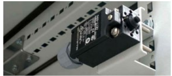
Ejemplo de instalación

El final de carrera para armario consigue un perfecto control de la iluminación del armario y un ahorro energético previniendo cualquier gasto ocasionado por el olvido del apagado.