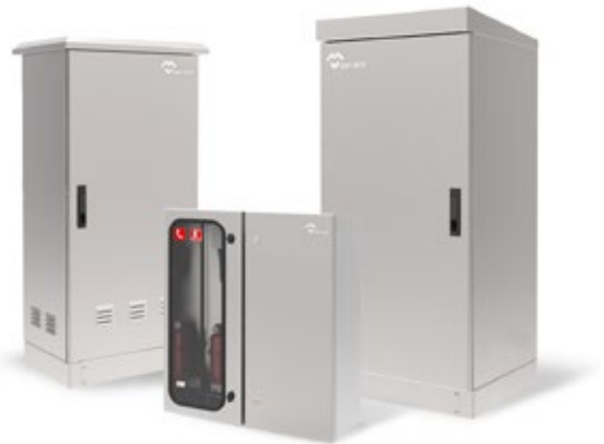
ARMARIOS DE INTEMPERIE ESTANCOS