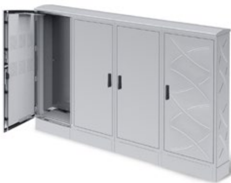
SOLUCIONES ELÉCTRICAS PARA NÚCLEOS URBANOS