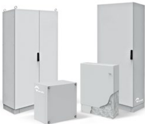
ARMOIRES ET COFFRETS ACIER GALVANISÉ