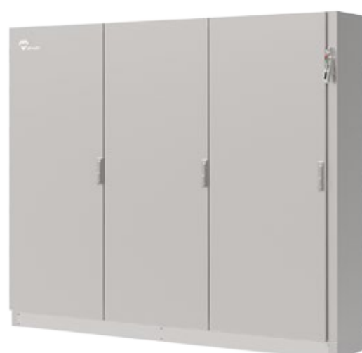
DISEÑO 3 PUERTAS Diseño con triple puerta.