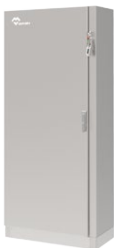
DISEÑO 1 PUERTA Armario de una sola puerta.