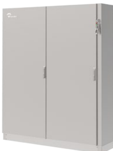
DISEÑO 2 PUERTAS Diseño con doble puerta.