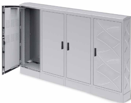
SOLUCIONES ELÉCTRICAS PARA NÚCLEOS URBANOS