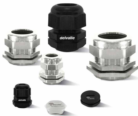
PRENSAESTOPAS PARA ARMARIOS ELÉCTRICOS