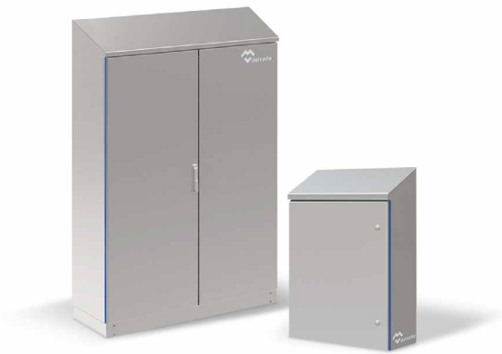
CAJAS HIGIÉNICAS CON TECHO INCLINADO