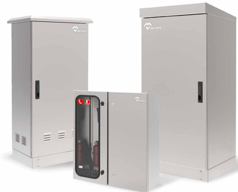
ARMARIOS DE INTEMPERIE ESTANCOS