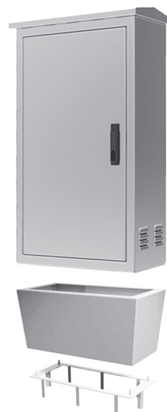
Détail de socle et base d'ancrage