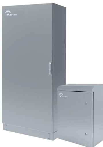
COFFRETS ELECTRIQUES ACIER INOXYDABLE