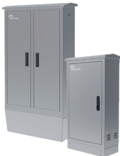
ARMOIRES ELECTRIQUES D'EXTÉRIEURS