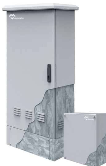
ARMOIRES ET COFFRETS ACIER GALVANISÉ PEINT