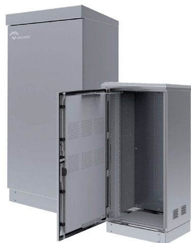
ARMOIRES RACK 19 RESEAUX TELECOMS OUTDOOR IP