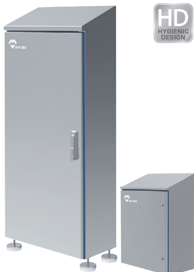
COFFRETS ARMOIRES HYGIENIC DESIGN