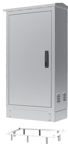
Détail de base d'ancrage

Delvalle offre une base d'ancrage nécessaire et conçue pour une préhension totale du boîtier pour éviter les mouvements et le déplacement du sol.