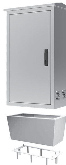
Zócalo inclinado con marco de anclaje