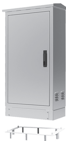
Zócalo plano con marco de anclaje

Como pueden ver en el detalle del gráfico la colocación es sencilla, sólo es necesaria la base o marco de anclaje que suministramos opcionalmente con el armario y que está diseñado para el agarre total del armario al suelo evitando desplazamientos y movimientos.