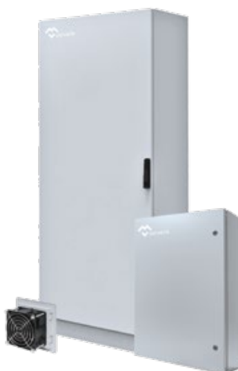
COFFRETS ARMOIRES ELECTRIQUES CEM