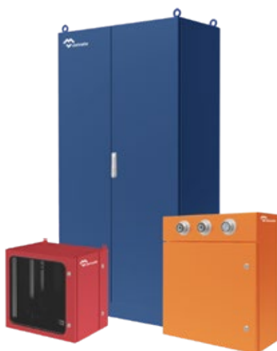
ARMOIRES COFFRETS ELECTRIQUES ACIER PEINT