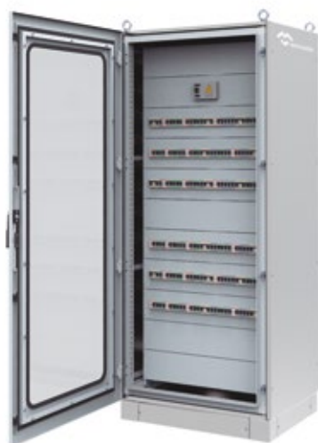
ARMOIRE MODULAIRE DE DISTRIBUTION