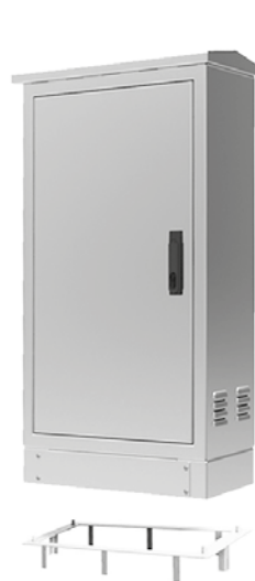
Detail de base d'ancrage

Delvalle offre un base d'ancrage nécessaire et conçue pour une préhension totale du boîtier pour éviter les mouvements et le déplacement du sol.