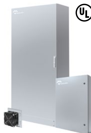
COFFRETS ARMOIRES NEMA TYPE I-3R-4X-12