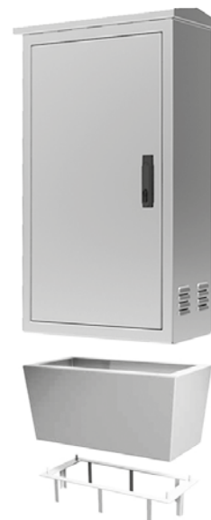
Detail de socle et base d'ancrage