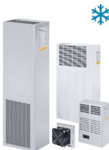
VENTILATION ET CLIMATISATION