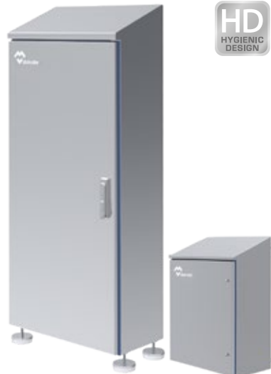
COFFRETS ARMOIRES HYGIENIC DESIGN