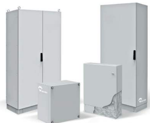
ARMOIRES ET COFFRETS ACIER GALVANISÉ