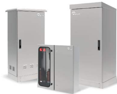
ARMOIRES ÉLECTRIQUES D'EXTÉRIEURS