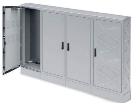
SOLUCIONES ELÉCTRICAS PARA NÚCLEOS URBANOS