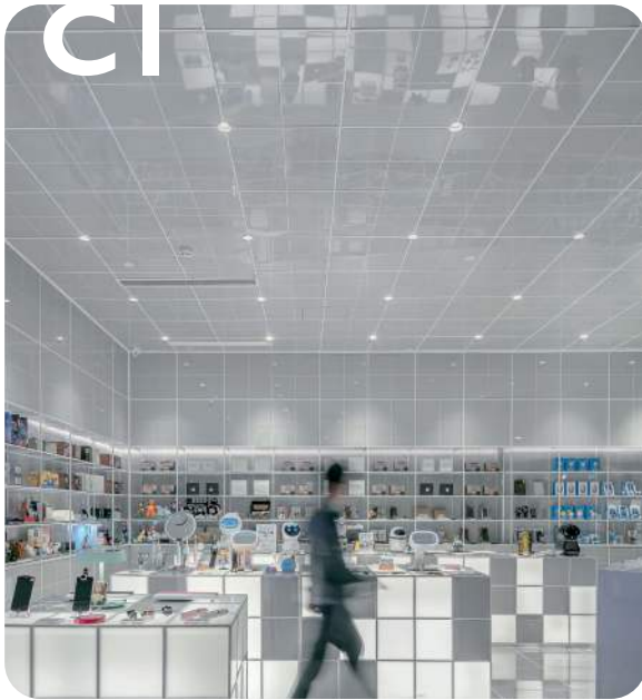
C1 - Comercio Oficinas, tiendas, escuelas, hoteles,...

De acuerdo a las tablas de clasificación podremos estimar la categoría a la que pertenece nuestra infraestructura. Veamos algunos ejemplos: