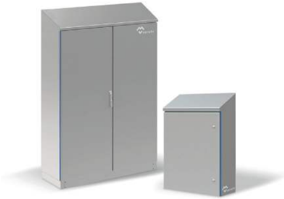
CAJAS HIGIÉNICAS CON TECHO INCLINADO