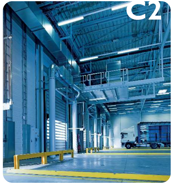
C2 - Almacén Almacenes, polideportivos,...