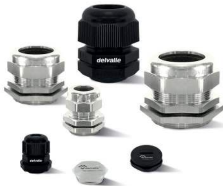
PRENSAESTOPAS PARA ARMARIOS ELÉCTRICOS