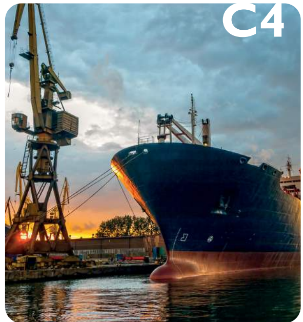
C4 - Puertos Plantas químicas, piscinas, barcos y astilleros,...