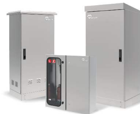
ARMARIOS DE INTEMPERIE ESTANCOS