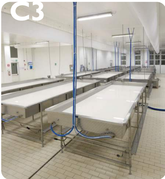
C3 - Industria alimentaria Plantas de proceso de alimentos, lavanderías,...