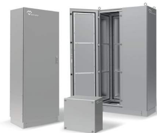
CAJAS Y ARMARIOS ELÉCTRICOS INOXIDABLES

Servicio ágil en un plazo máximo de 3 semanas desde la recepción del pedido. Totalmente flexibles, para todos los formatos y dimensiones. Somos el fabricante con mayor dimensiones certificadas en el mundo.