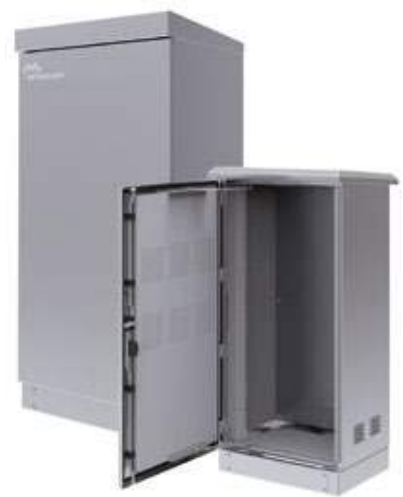
RACKS DE 19 EXTERIORES TELECOMUNICACIONES IP