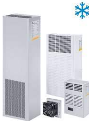
VENTILATION ET CLIMATISATION