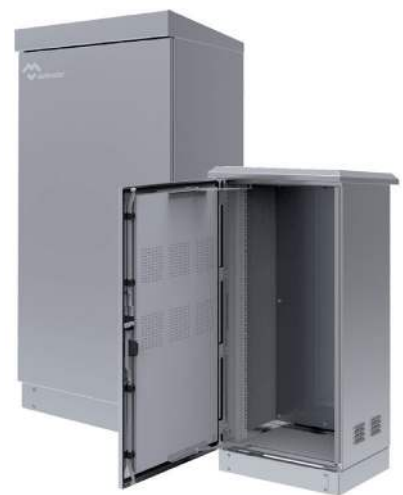
RACKS DE 19 EXTERIORES TELECOMUNICACIONES IP