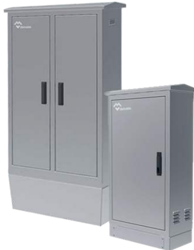
ARMARIOS ELÉCTRICOS DE INTEMPERIE ESTANCOS