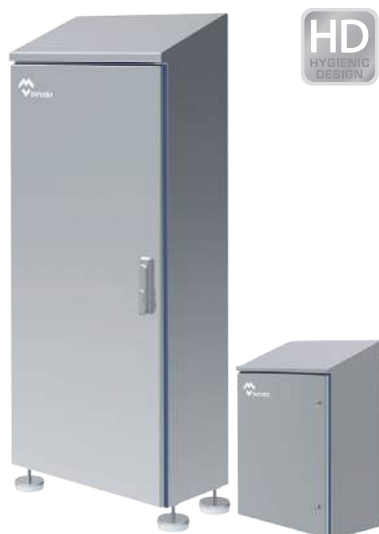
ARMARIOS Y CAJAS HYGIENIC DESIGN