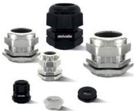
PRENSAESTOPAS PARA ARMARIOS ELÉCTRICOS