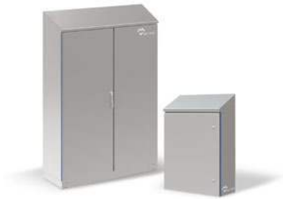
CAJAS HIGIÉNICAS CON TECHO INCLINADO