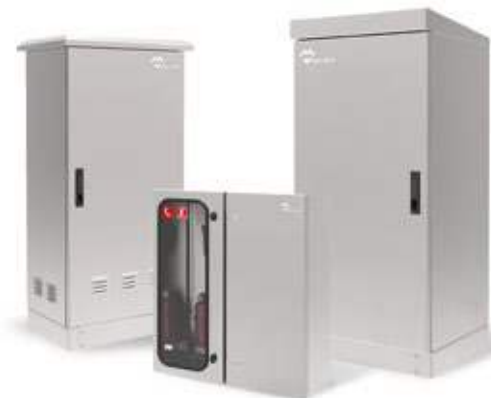
ARMARIOS DE INTEMPERIE ESTANCOS