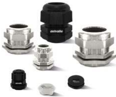
PRENSAESTOPAS PARA ARMARIOS ELÉCTRICOS