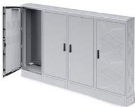
SOLUCIONES ELÉCTRICAS PARA NÚCLEOS URBANOS