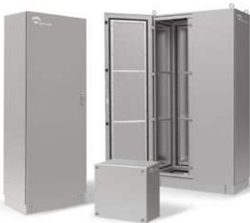
CAJAS Y ARMARIOS ELÉCTRICOS INOXIDABLES

Servicio ágil en un plazo máximo de 3 semanas desde la recepción del pedido. Totalmente flexibles, para todos los formatos y dimensiones. Somos el fabricante con mayor dimensiones certificadas en el mundo.