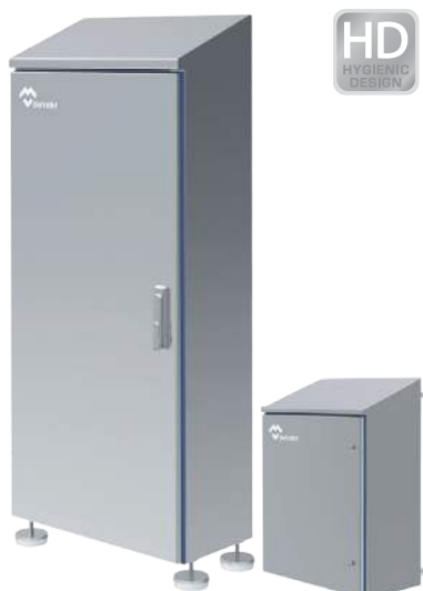
ARMARIOS Y CAJAS HYGIENIC DESIGN