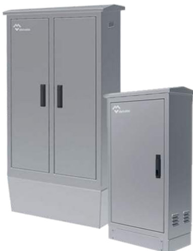
ARMARIOS ELÉCTRICOS DE INTEMPERIE ESTANCOS