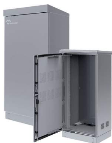
RACKS DE 19 EXTERIORES TELECOMUNICACIONES IP