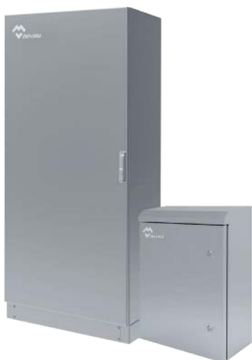
ARMARIOS Y CAJAS ELÉCTRICAS ACERO INOXIDABLE