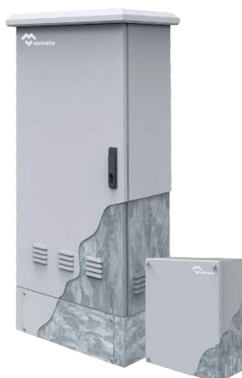
ARMARIOS Y CAJAS ELÉCTRICAS EN GALVANIZADO