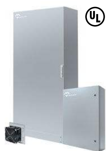
CAJAS Y ARMARIOS NEMA TYPE 1-3R-4X-12