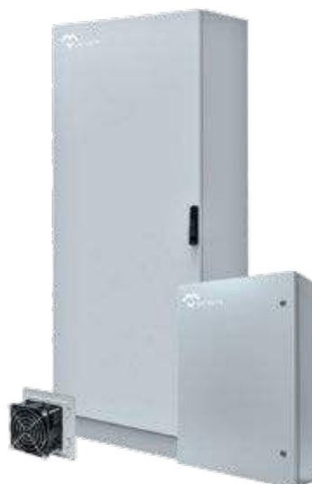
CAJAS Y ARMARIOS ELÉCTRICOS EMC