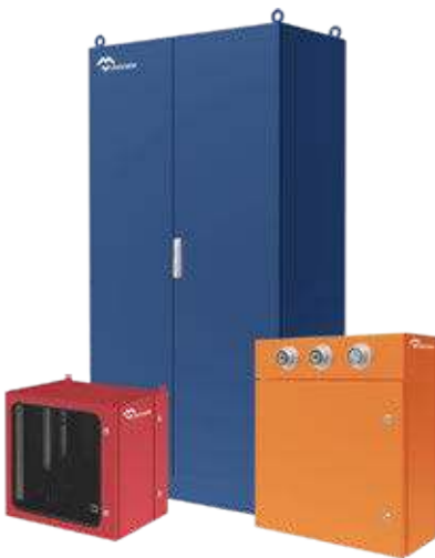
CAJAS Y ARMARIOS ELÉCTRICOS DE ACERO PINTADO