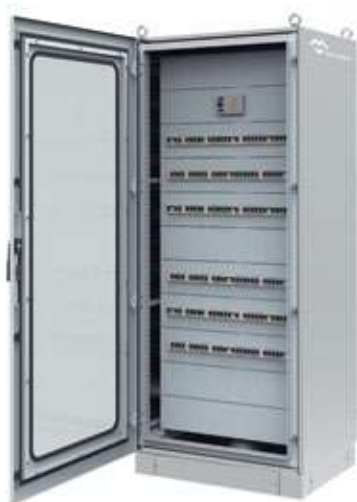
CAJAS Y ARMARIOS ELÉCTRICOS DE DISTRIBUCIÓN