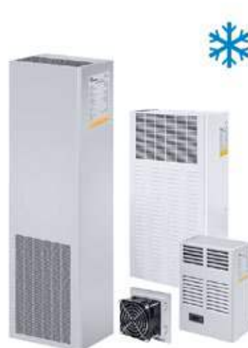
VENTILACIÓN Y CLIMATIZACIÓN DE ARMARIOS ELÉCTRICOS