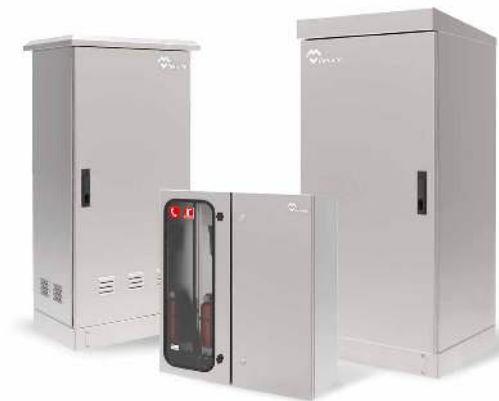
ARMARIOS DE INTEMPERIE ESTANCOS