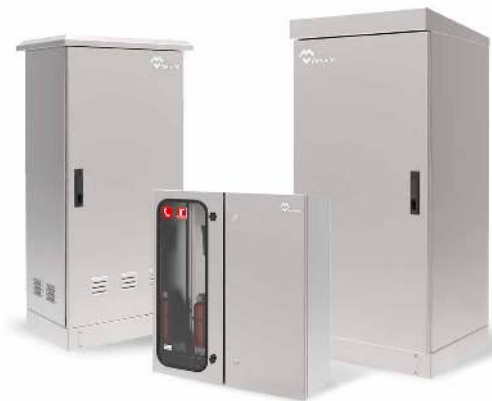
ARMARIOS DE INTEMPERIE ESTANCOS