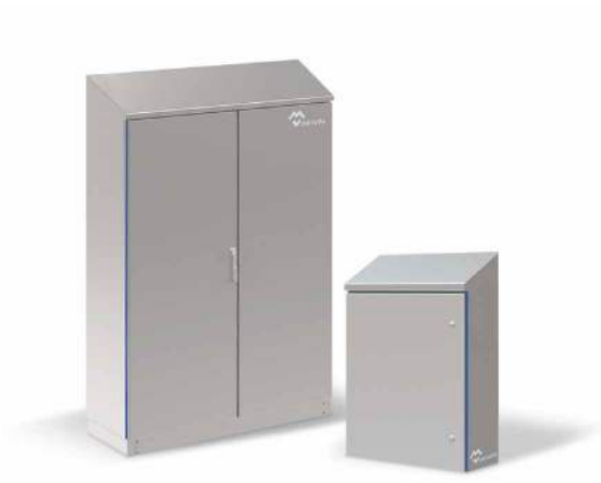
CAJAS HIGIÉNICAS CON TECHO INCLINADO