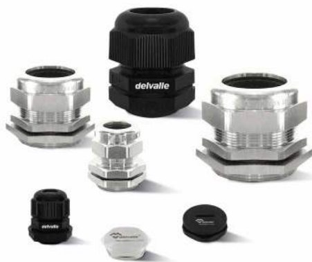
PRENSAESTOPAS PARA ARMARIOS ELÉCTRICOS