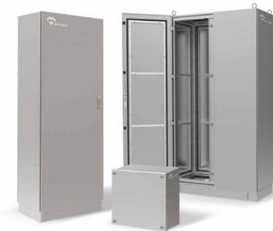
CAJAS Y ARMARIOS ELÉCTRICOS INOXIDABLES

Servicio ágil en un plazo máximo de 3 semanas desde la recepción del pedido. Totalmente flexibles, para todos los formatos y dimensiones. Somos el fabricante con mayor dimensiones certificadas en el mundo.