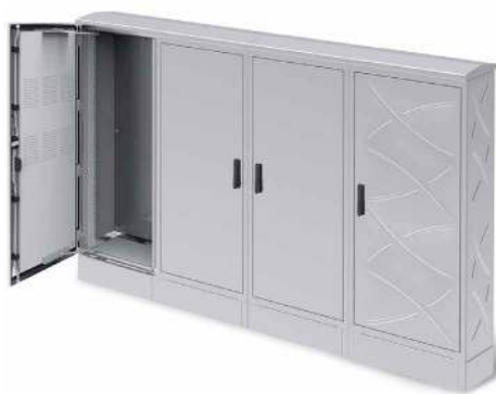
SOLUCIONES ELÉCTRICAS PARA NÚCLEOS URBANOS