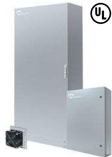
COFFRETS ARMOIRES NEMA TYPE I-3R-4X-12