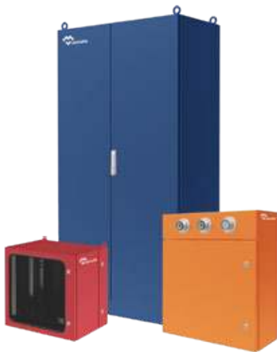
ARMOIRES COFFRETS ELECTRIQUES ACIER PEINT