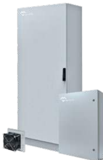
COFFRETS ARMOIRES ELECTRIQUES CEM