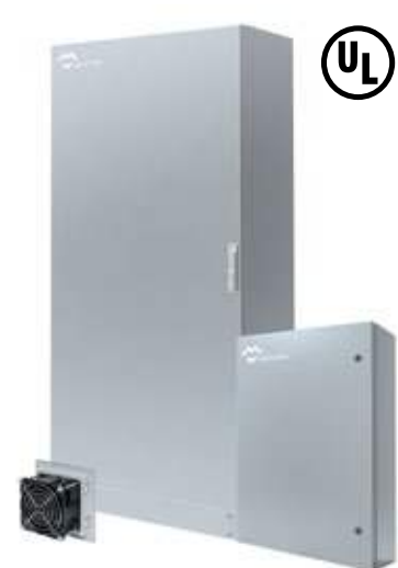
COFFRETS ARMOIRES NEMA TYPE I-3R-4X-12