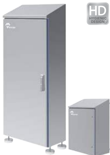
COFFRETS ARMOIRES HYGIENIC DESIGN