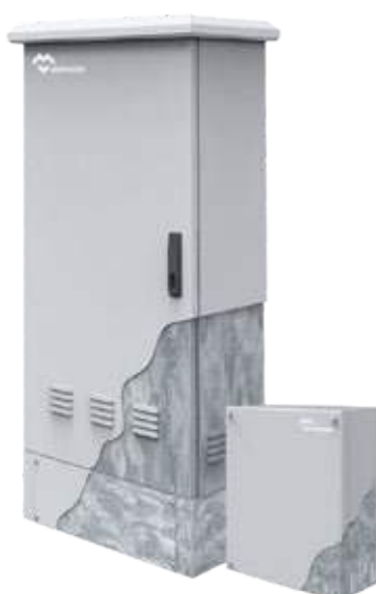
ARMOIRES ET COFFRETS ACIER GALVANISÉ PEINT