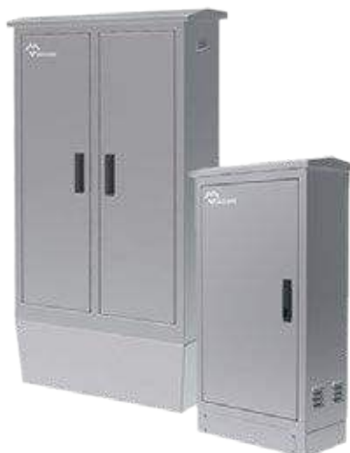
ARMOIRES ELECTRIQUES D'EXTÉRIEURS