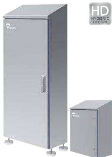
COFFRETS ARMOIRES HYGIENIC DESIGN