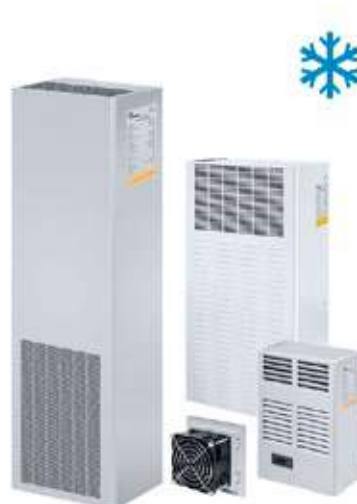
VENTILATION ET CLIMATISATION