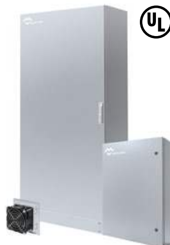
COFFRETS ARMOIRES NEMA TYPE I-3R-4X-12