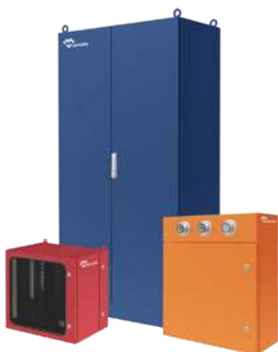
ARMOIRES COFFRETS ELECTRIQUES ACIER PEINT