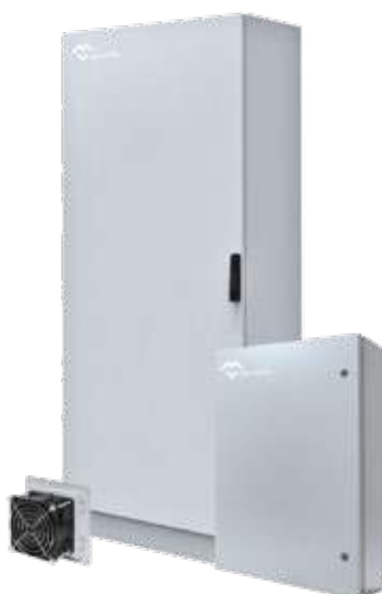
COFFRETS ARMOIRES ELECTRIQUES CEM