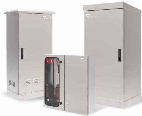
ARMOIRES ÉLECTRIQUES D'EXTÉRIEURS