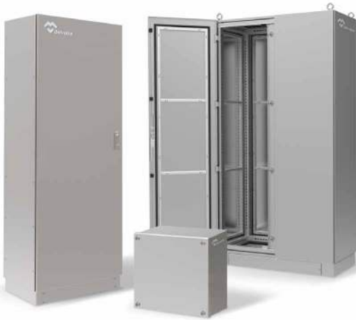
COFFRETS ÉLECTRIQUES ACIER INOXYDABLE