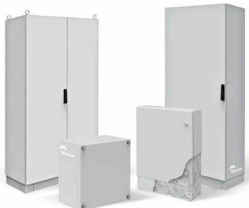
ARMOIRES ET COFFRETS ACIER GALVANISÉ