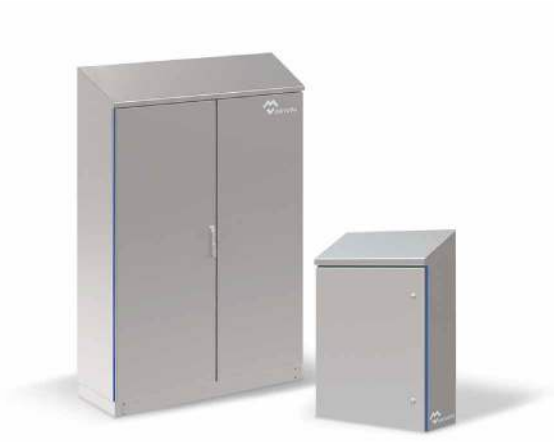
COFFRETS TOIT INCLINÉ - HYGIENIC