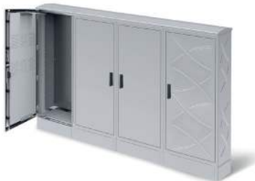
SOLUTIONS ÉLECTRIQUES POUR L'EXTÉRIEUR