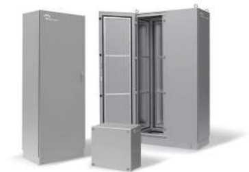
COFFRETS ET ARMOIRES EN ACIER INOXYDABLE

Avec des certifications qui répondent aux normes internationales les plus élevées, nous garantissons un service agile, avec des livraisons dans un délai pouvant aller jusqu'à 3 semaines. En outre, notre flexibilité en matière de formats et de dimensions fait de nous le fabricant ayant le plus grand nombre de certifications dans le monde.