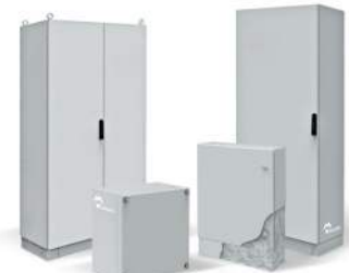
ARMOIRES ET COFFRETS GALVANISÉS