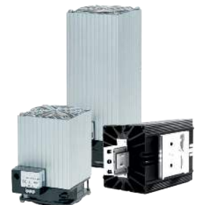
RÉSISTANCES DE CHAUFFAGE