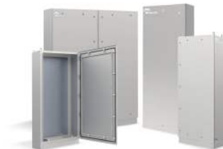
ARMOIRES ET COFFRETS ATEX