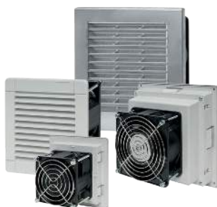
VENTILATEURS AVEC FILTRE