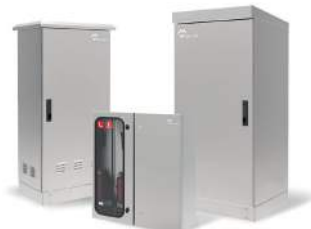
BOÎTIERS EXTÉRIEURS ÉTANCHES