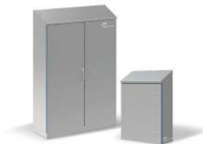
BOÎTES HYGIÉNIQUES AVEC TOIT INCLINÉ