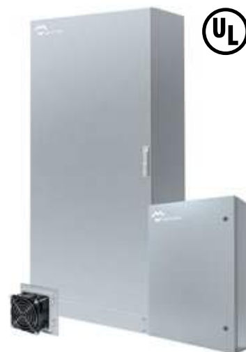
COFFRETS ARMOIRES NEMA TYPE 1-3R-4X-12