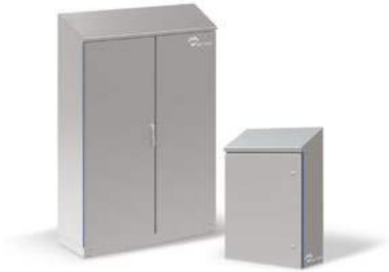
COFFRETS TOIT INCLINÉ - HYGIENIC