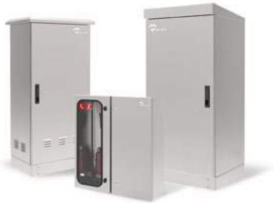
ARMOIRES ÉLECTRIQUES D'EXTÉRIEURS