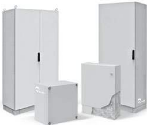
ARMOIRES ET COFFRETS ACIER GALVANISÉ