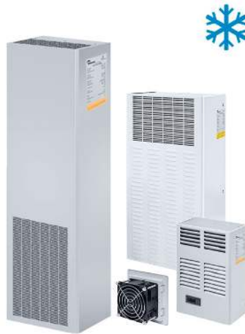
VENTILATION ET CLIMATISATION