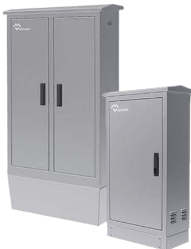
ARMOIRES ELECTRIQUES D'EXTÉRIEURS