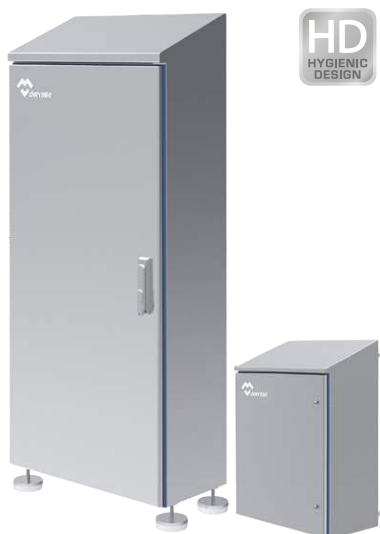
COFFRETS ARMOIRES HYGIENIC DESIGN