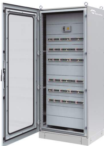
ARMOIRE MODULAIRE DE DISTRIBUTION