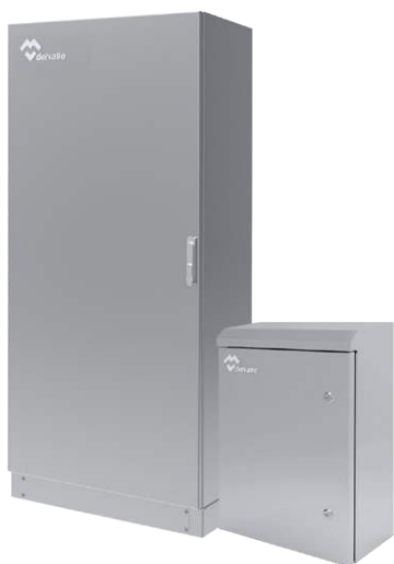
COFFRETS ELECTRIQUES ACIER INOXYDABLE