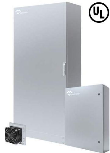
COFFRETS ARMOIRES NEMA TYPE I-3R-4X-12