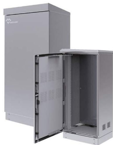
ARMOIRES RACK 19 RESEAUX TELECOMS OUTDOOR IP