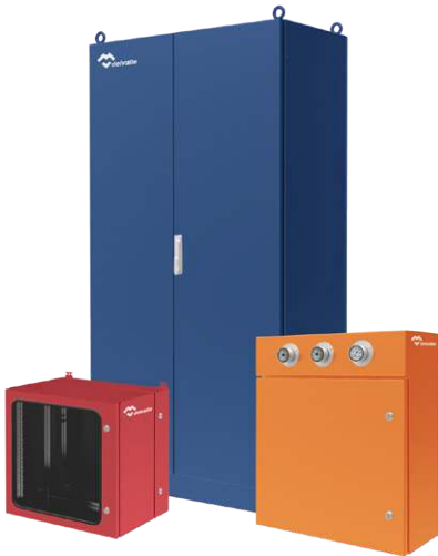
ARMOIRES COFFRETS ELECTRIQUES ACIER PEINT