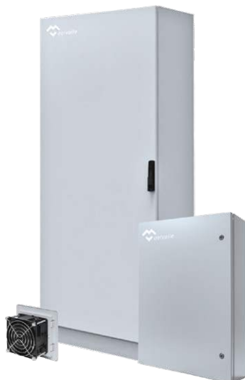
COFFRETS ARMOIRES ELECTRIQUES CEM