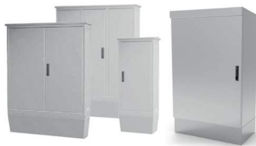
ARMARIOS DE INTEMPERIE