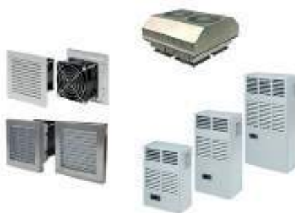
CLIMATIZACIÓN Y REFRIGERACIÓN