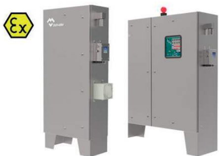
ARMARIOS ATEX Y PRESURIZADOS ATEX