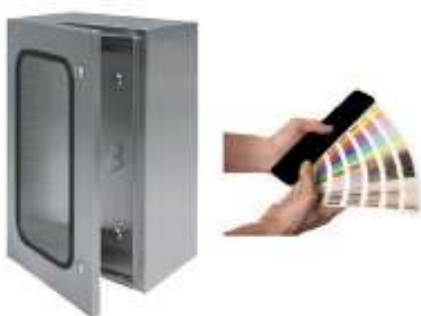
ACCESORIOS Y COMPLEMENTOS