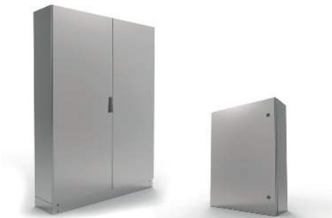
ARMARIOS EN ACERO INOXIDABLE