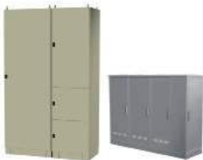
ARMARIOS Y CAJAS INDUSTRIALES