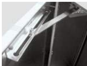
RETENEDOR DE PUERTA