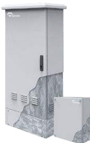
ARMOIRES ET COFFRETS ACIER GALVANISÉ PEINT