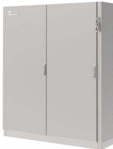
DESIGN 2 PORTES Design à porte double.