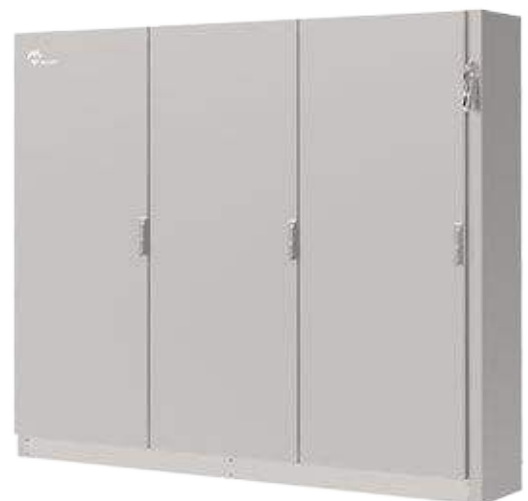
DESIGN 3 PORTES Design à porte triple.