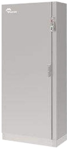
DESIGN BASIQUE Armoire à portes battantes