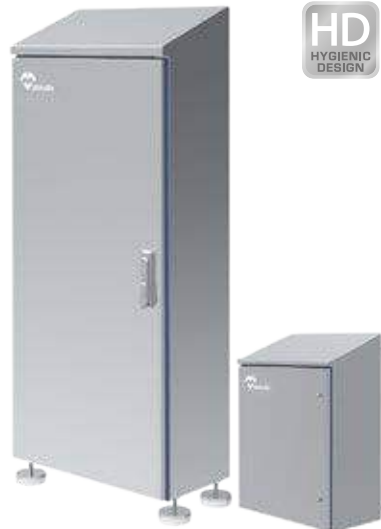
COFFRETS ARMOIRES HYGIENIC DESIGN